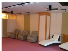
ソフィア・A・C・クリニック 改修工事