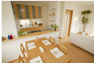
キッチンカウンターとダイニング